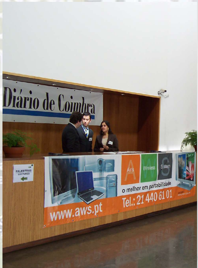
Balcão de Recepção da ACEE.

Uma vez na ACEE, tínhamos um balcão de recepção, onde era confirmado o nosso registo, e éramos postos a par do calendário das diversas actividades que integravam a ACEE.