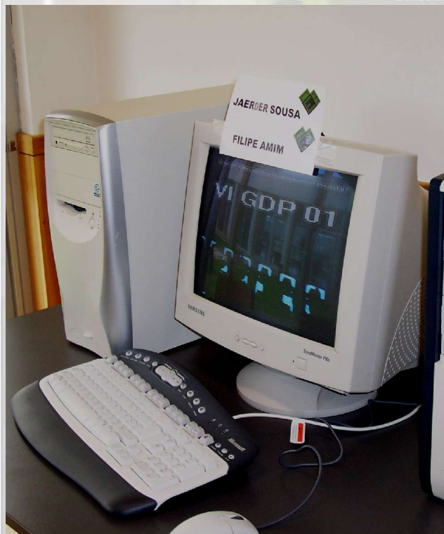
VIGDP 1 , por Jaerder Sousa e Filipe Amin (Volumetric Illusions demogroup)